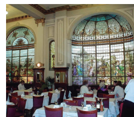
CONFITERIA LAS VIOLETAS